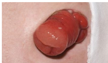
Stomie po operaci